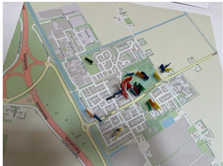
De ideale plek voor een nieuw schoolgebouw